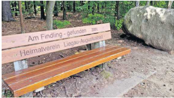
Am Findling, An den Folgen

Der Gutsfriedhof in unserem Ort am Ende des Ulmenweges braucht im Frühjahr und im Herbst entsprechende Pflege. Zurzeit wird auch dies noch von unseren älteren Vereinsmitgliedern übernommen. Könnten Sie sich vorstellen, mit zu helfen und die Pflege zukünftig als Patenschaft zu übernehmen?