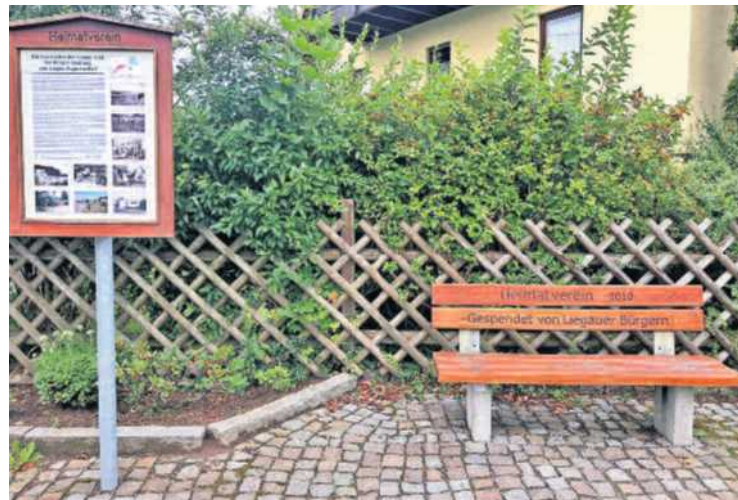
Am Siedlerbrunnen, Friedrich-Engels-Straße